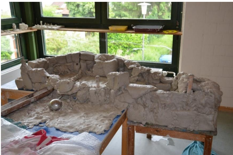
Charlottes Burg (6 Jahre), erstellt mit 4 Freunden

Das Evangelische Kinderhaus Panama in Heidelberg war die erste zertifizierte PädArT-Einrichtung in Deutschland. Von 2010 bis 2020 wurde dort allen Kindern täglich Ton in den Gruppenräumen und im Außengelände angeboten. Ton war in dieser Zeit ein vertrautes Alltagsmaterial und fest in die pädagogische Arbeit der Einrichtung integriert.