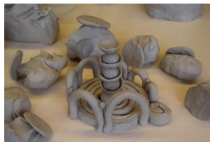
Tonprozess: Ton zentriert, Eine systemische Aufstellung mit Ton