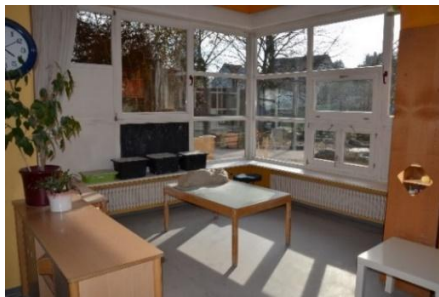
Das PädArT-Atelier in der Ev. Kita Modau in Ober-Ramstadt

Im gemeinsam erlebten kreativen Prozess können Begegnungen stattfinden, Beziehungen entstehen und neue Erfahrungsräume eröffnet werden. Der Raum unterstützt damit nicht nur das Arbeiten am Ton, sondern auch die Entwicklung von Wahrnehmung, Selbsttätigkeit, Beziehung und Ausdruck.