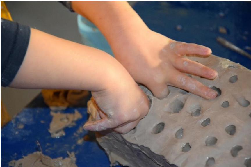
Karl (5 Jahre) bohrt mit beiden Zeigefinger Löcher in den Tonblock.