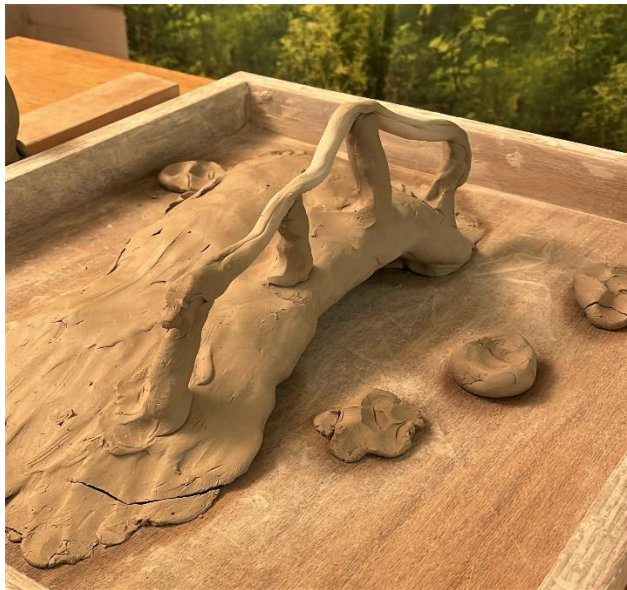
Tonprozess: Brücken bauen Wie gelange ich hinüber? Was erwartet mich dort?