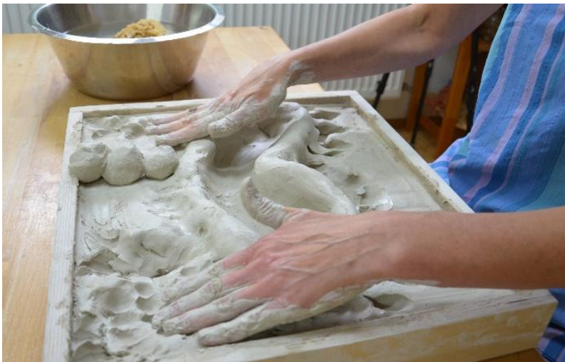
Tonprozess am Feld