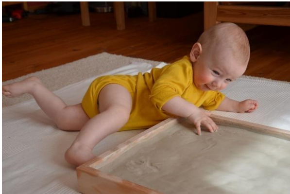
Oskar (9 Monate) am Tonspielfeld

besonderes Erfahrungsfeld: Er nimmt Impulse auf, gibt Rückmeldung, hält Spuren fest und ermöglicht Veränderung. So kann der Mensch sich im eigenen Tun erleben, innere und äußere Bewegungen miteinander verbinden und neue Formen des Ausdrucks und der Selbstwahrnehmung entwickeln.