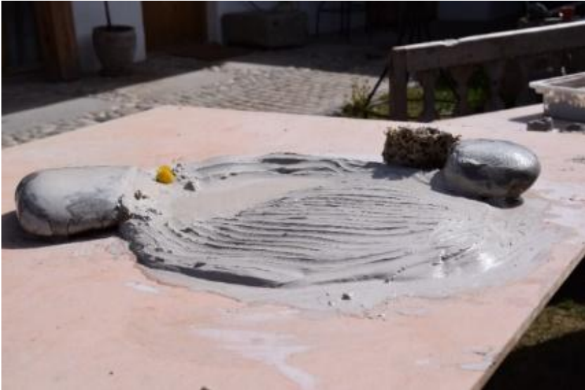
Strömen zwischen zwei Polen, den eigenen Weg finden. Wachsen